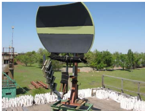
Рис. 2. Макетный образец сверхширокополосной многолучевой зеркальной антенны

зеркальная антенна, у которой ширина главных лепестков ДН слабо зависит от частоты в угломестной плоскости в диапазоне частот более чем 3 октавы (рис. 2).